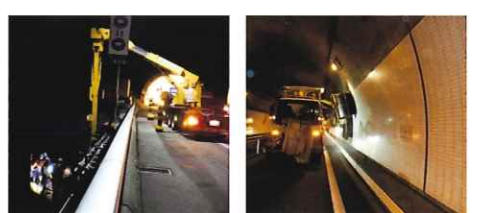
橋梁点検車を用いた橋梁下面および橋桁の点検 トンネルの側壁清掃