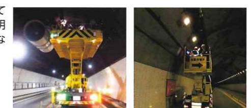
トンネルジェットファン点検 トンネル照明設備点検